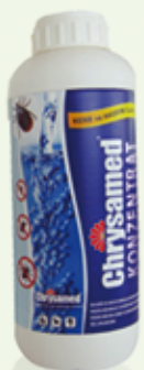
1 Liter Konzentrat