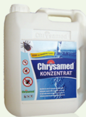
5 Liter Konzentrat